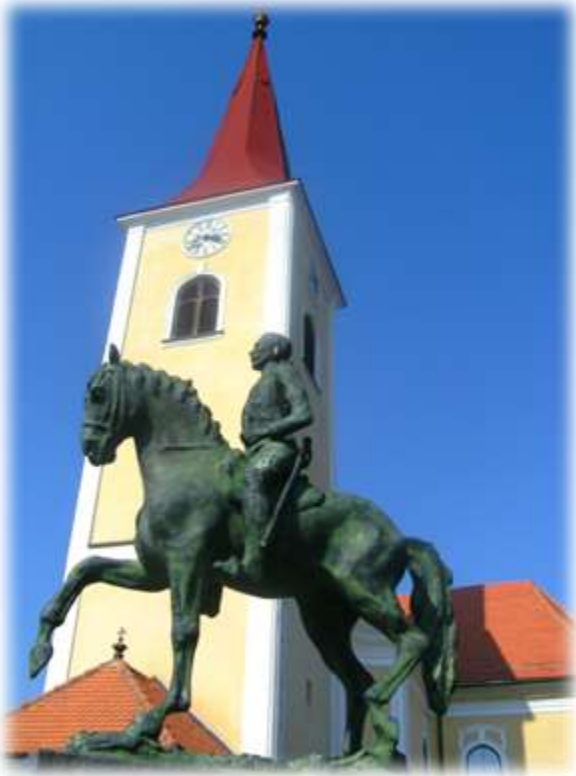
Slika 71: Spomenik Rudolfu Maistru

V bližini cerkve stojita kipa pesnika, slikarja in generala Rudolfa Maistra na konju, ter pisatelja Frana Ksavra Meška.