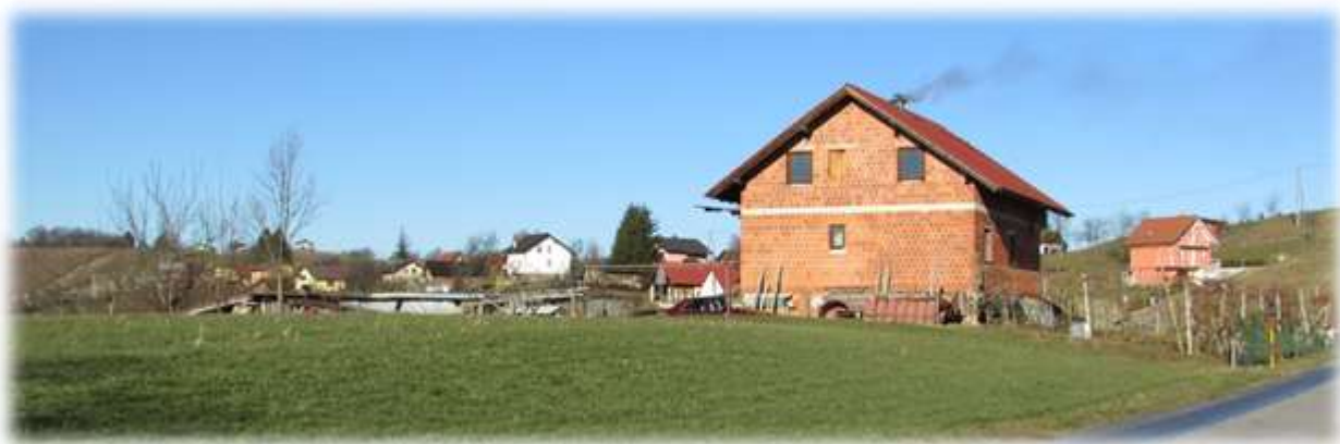
Slika 61: Po cesti navzgor čez Senčak