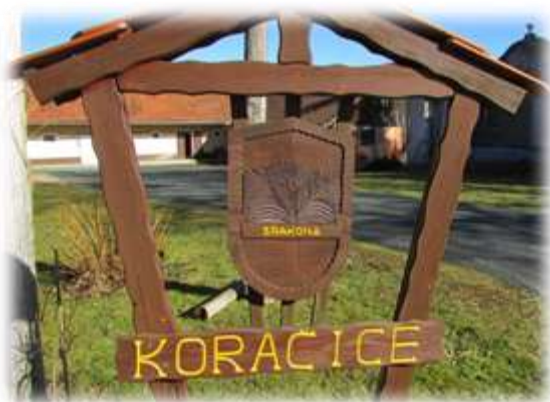
Slika 24: Grb vasi Koračice

Vaščani so si za svojega zavetnika izbrali srakono. To je nadležen enoletni plevel, ki je tukaj po njivah in med šmarnico prevladoval nad vsemi ostalimi pleveli. Danes so jo s škropljenjem dodobra izkoreninili, kot ostanek preteklosti pa se je ohranila v vaškem grbu. 17