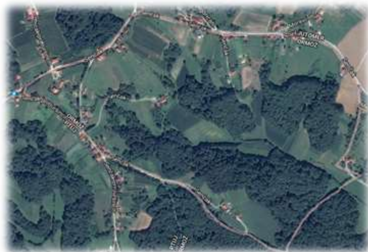
Slika 60: Senčak iz zraka

Ker je v teh krajih sadjarstvo imelo pomembno vlogo, so za svoj grb izbrali jabolko, saj je ljudi ta žlahtni sadež pozdravljal že od daleč. 37