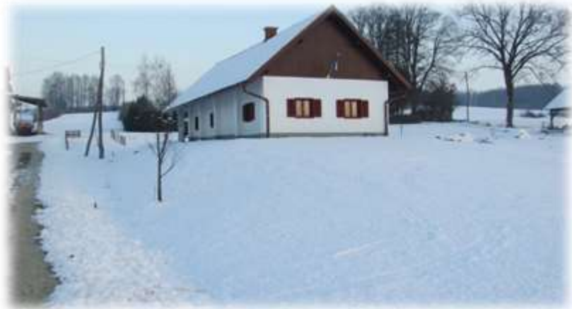
Slika 49: Cajnkárjeva domačija pozimi