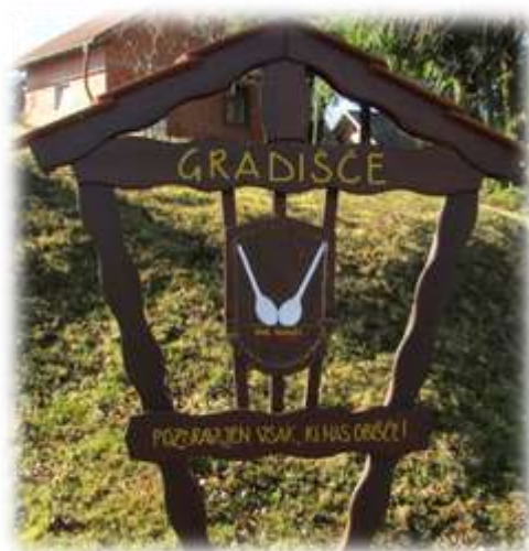
Slika 14: Grb vasi Gradišče

Če pri domačiji Gradišče 2 zavijete na breg, vas bo na vrhu pričakal čudovit razgled proti jugu. Na številki Gradišče 6 stojita cimprana in butana domačija. Na domačiji Gradišče št. 9 si lahko ogledate obsežno hortikulturno zbirko, predvsem rododendronov in magnolij.