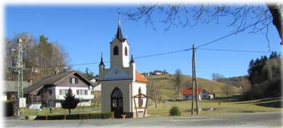
Slika 37: Središče Pršetincev – vaška kapela