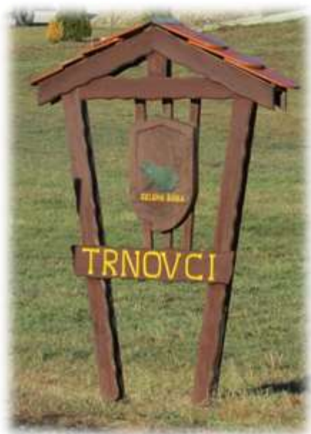
Slika 77: Grb vasi Trnovci