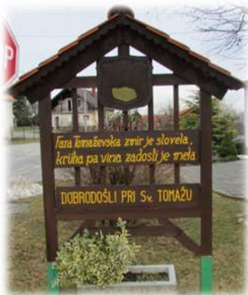
Slika 67: Grb vasi Sveti Tomaž

Tomaževčani so svoj vaški grb prikrojili življenju. Pomembnost grba je v krompirju, torej v kulturni rastlini, ki je prišla v Evropo v 16. stoletju. Krompir so najprej gojili kot okrasno rastlino, ki so jo pozneje začeli polagati živini. Vojne, naravne ujme povezane z lakoto, so oblast v 18. stoletju prisilile uvajati krompir kot hrano tudi za ljudi. Tomaževčani so ga kot odrešilno kulturno rastlino sprejeli v svoj vaški grb. Morda pa so namigovali z besedo »krampir« (tako ga ponekod v Prlekiji imenujejo) na današnjo zaostalost tamkajšnjih prebivalcev – »da zabitemu kmetu zraste najdebelejši krompir«. Tudi mogoče, da so Tomaževčanom v zafrkljivosti »obesili« v vaški grb plod divjega kostanja (zaselek Kostanj), ki ga je bilo v okolici v izobilju in se šalili na račun krompirja, ki mu je po otipu podoben. V hudih časih, ko je prebivalstvo pestila lakota, so plodove kostanja skupaj z želodom uporabljali v prehrani - za peko kruha. 43