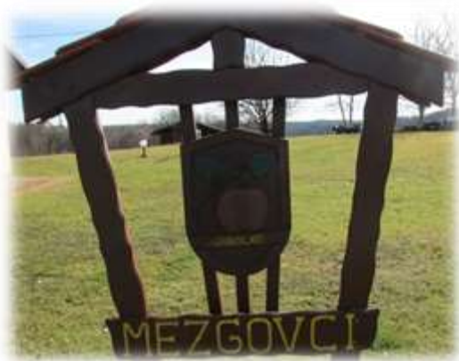
Slika 32: Grb vasi Mezgovci

Ker je v teh krajih sadjarstvo imelo pomembno vlogo, so za svoj grb izbrali jabolko, saj je ljudi ta žlahtni sadež pozdravljal že od daleč. 22