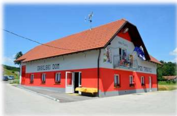
Slika 76: Gasilski dom, Trnovci