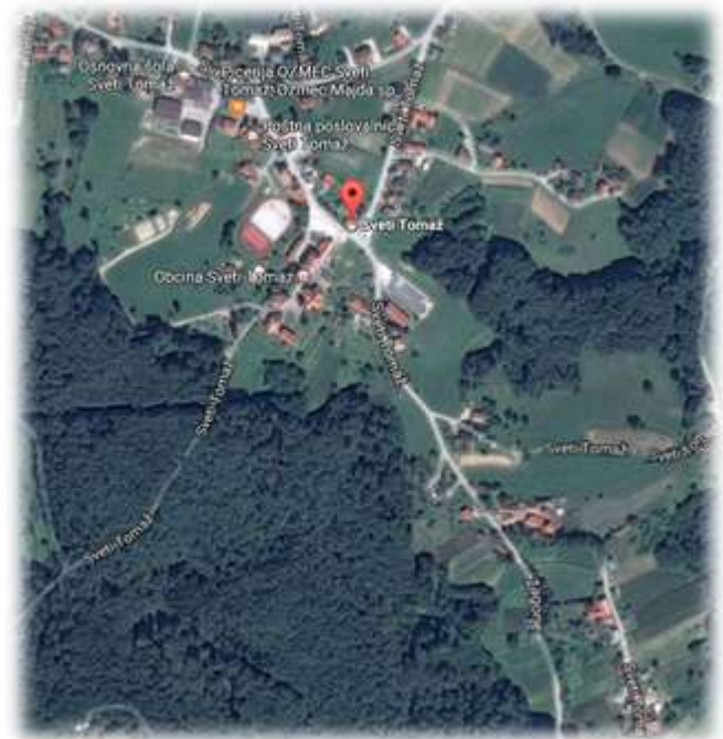
Slika 68: Sveti Tomaž iz zraka