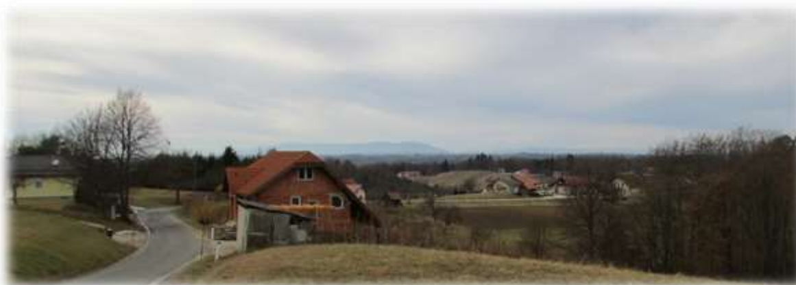
Slika 80: Pogled iz Zagorja proti Pohorju

Od tu lahko zvečer v daljavi zagledate razsvetljeni Ptujski grad.