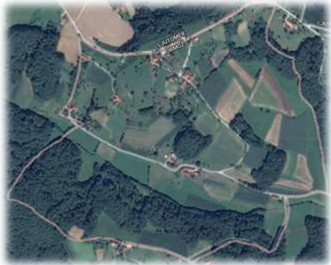
Slika 33: Mezgovci iz zraka