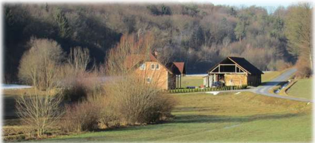
Slika 34: Sonce v Mezgovski dolini