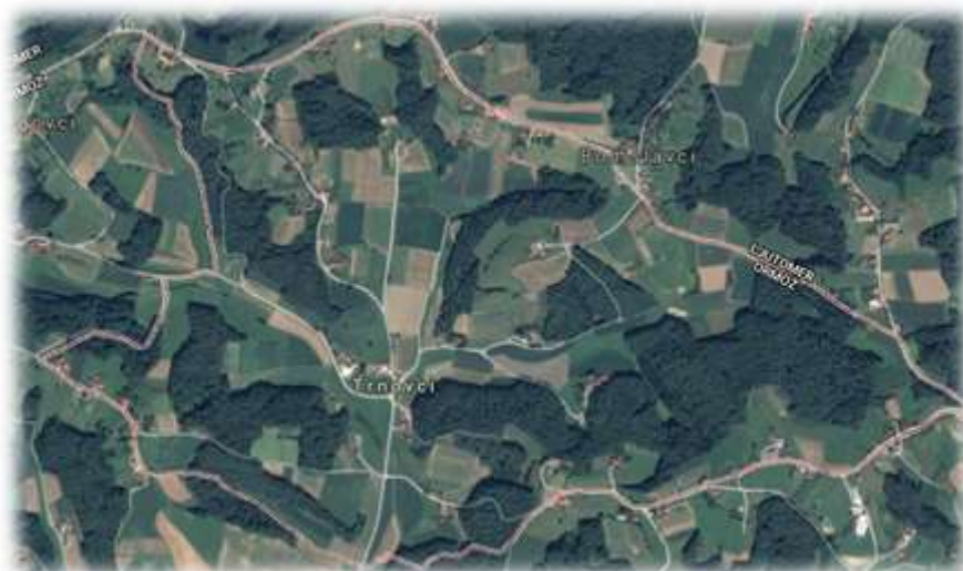
Slika 75: Trnovci iz zraka

Tudi v Trnovcih najdemo gnezdišča redke ptice zlatovranke. Ker je bila dolina že od nekdaj močvirska, ima vas v ljudskem grbu zeleno žabo. 46