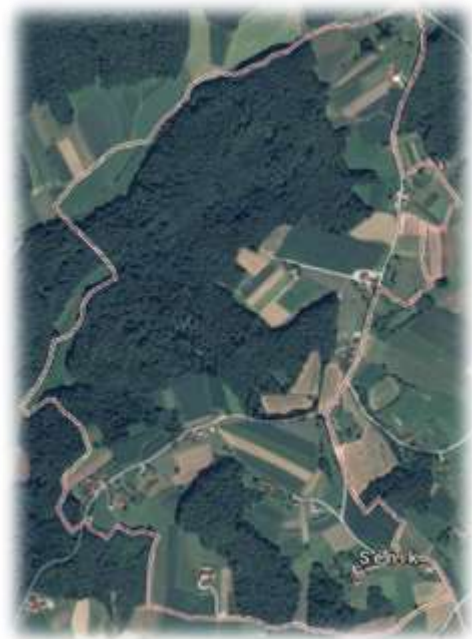
Slika 65: Senik iz zraka