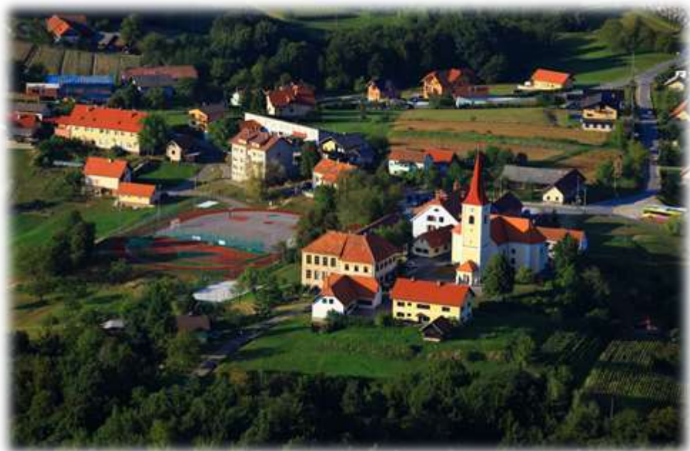
Slika 4: Pogled na »Pürgo«, center Svetega Tomaža