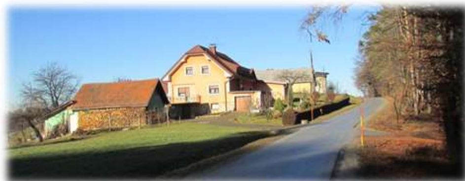
Slika 40: Iz sence na sonce v Rakovcih