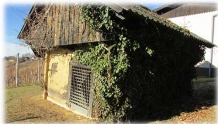
Slika 31: Najstarejša ključaja