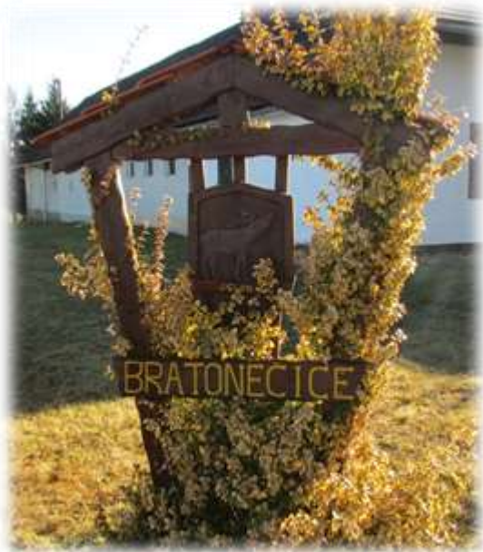
Slika 6: Grb vasi Bratonečice

V vaškem grbu se nahaja jelen, plaha a veličastna žival, ki si je svoj mir izboril med hrasti in vrbjem. Raznovrstnost živalskega sveta je v tem kmečkem okolju pustila močan pečat. Danes boste v Bratonečkih gozdovih srečali večje število srnjadi. 6