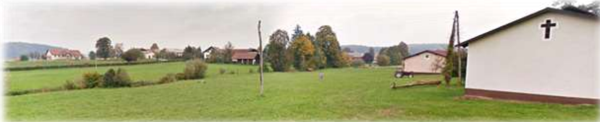
Slika 8: Pogled na vas Bratonečice