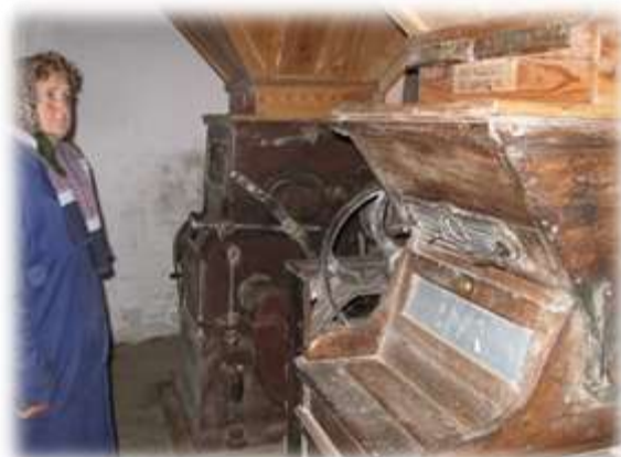
Slika 54: Notranjost Stajnkovega mlina

VIR: http://www.ventilatorbesed.com/?opcija=kom_clanki&oce=79&id=784