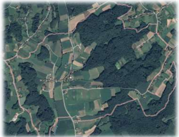
Slika 18: Hranjigovci iz zraka