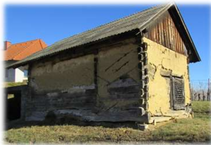
Slika 19: Cimprana ključaja v Hranjigovcih