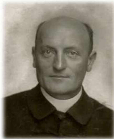
Slika 12: Fran Ksaver Meško

Pisal je pesmi, novele, črtice, povesti, romane in drame. Pisati je začel v gimnaziji, najprej pesmi, nato prozo. V svojih deli je razmišljal o mladosti, ponižanih, trpečih ter o duhovnosti in umetnosti. Danes ga literarni zgodovinarji ne postavljajo na vidno mesto. 9