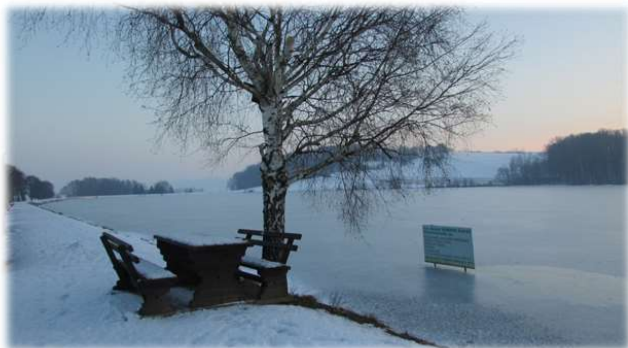
Slika 53: Led na Savskem ribniku