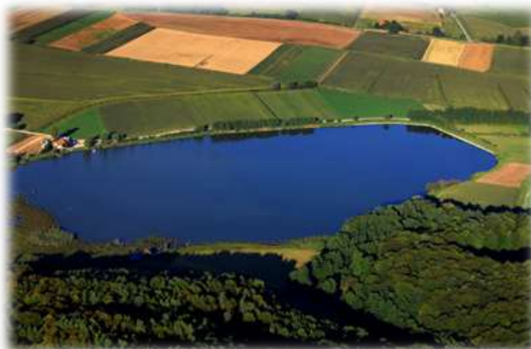
Slika 50: Savski ribnik iz zraka

O dodatnih možnostih, ki bi jih lahko ponudili obiskovalcem so razmišljale učenke pri krožku Spodbujanje ustvarjalnosti, podjetnosti in inovativnosti (Priloga 2)