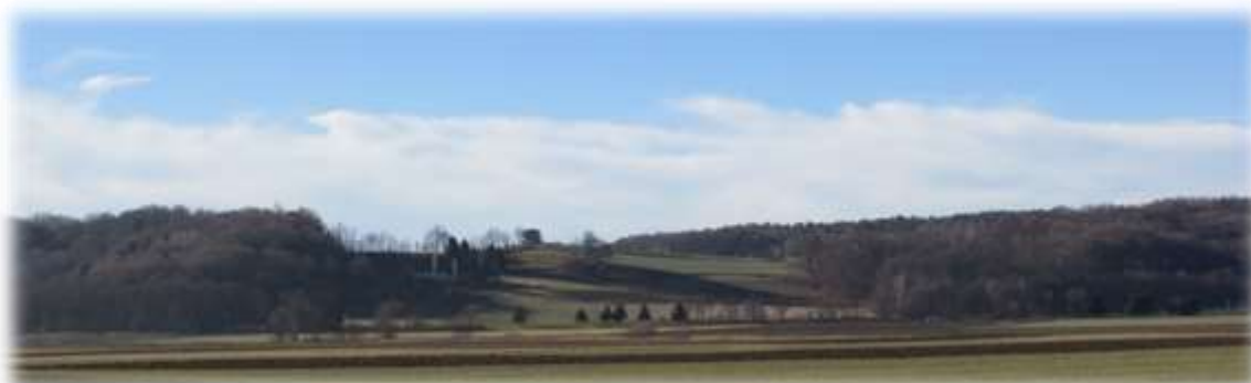
Slika 47: Pogled proti Savskemu ribniku