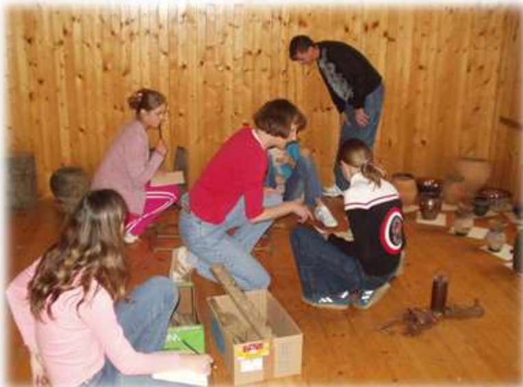
Slika 74: Učenci med sortiranjem starih predmetov

http://static.panoramio.com/photos/original/89685479.jpg