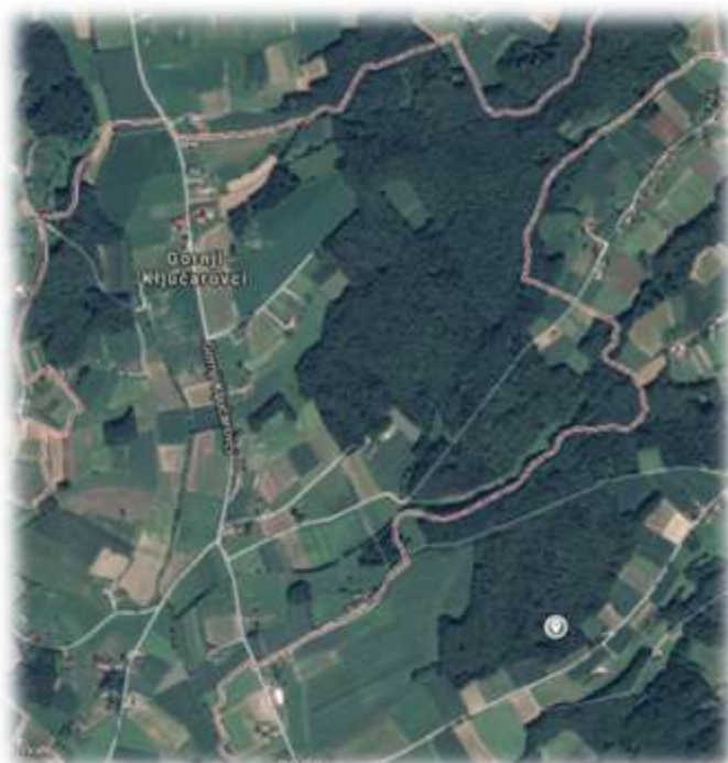
Slika 10: Gornji Ključarovci iz zraka