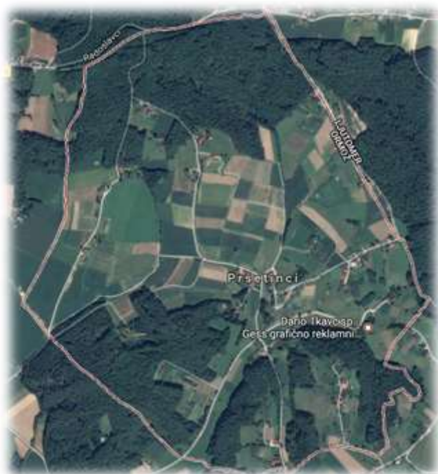
Slika 36: Pršetinci iz zraka