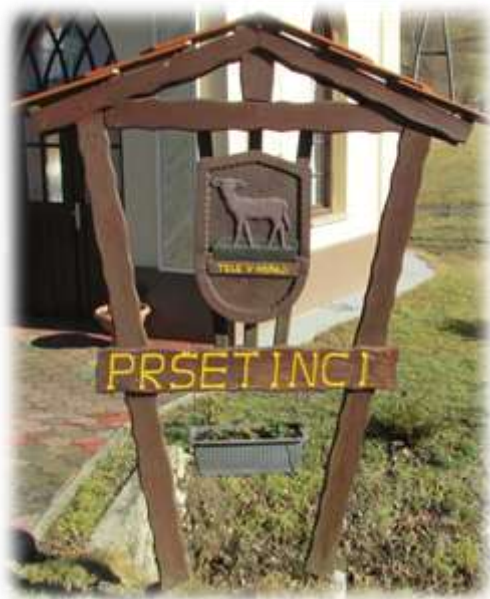
Slika 35: Grb vasi Pršetinci

Na vaškem grbu je tele v »kopaji« - Pršetani koljejo tele v kopaji, iz katere z žlico (z žehtarji) zajemajo kri. 24