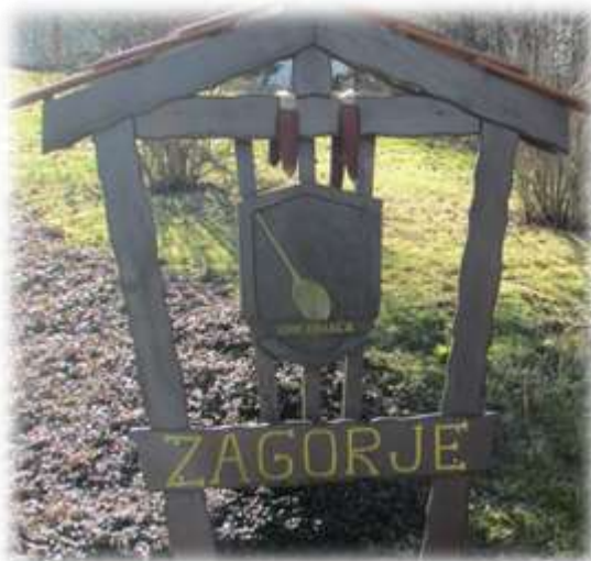
Slika 78: Grb vasi Zagorje

V vaškem grbu je ena »kihača« (kuhalnica). Prvotno so imeli v svojem grbu bürkle. Ker so jih izgubili, so jim dobrosrčni Gradiščani posodili svojo kihačo. 48 Bürkle so pripomoček, s katerim so se v krušno peč dajale in premikale razne posode.