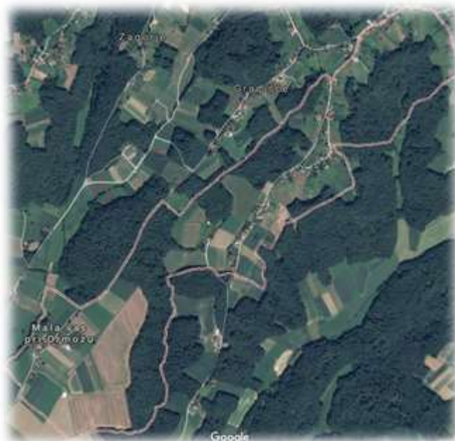
Slika 30: Mala vas iz zraka