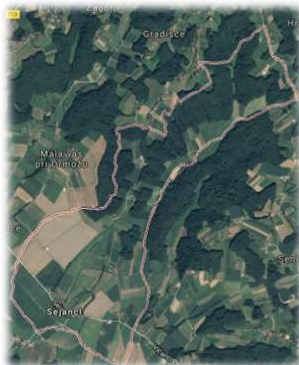
Slika 58: Sejanca iz zraka