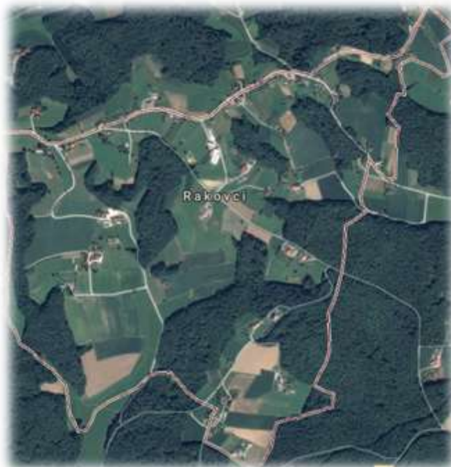
Slika 39: Rakovci iz zraka