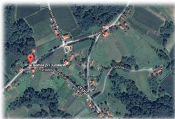
Slika 62: Gomila iz zraka

Na Gomili se stikajo 4 občine: Sv. Jurij ob Ščavnici, Ljutomer, Juršinci in Sv. Tomaž. 38 V ljudskem izročilu se je ohranila pripoved, da so se ob nedeljskih popoldnevih tu srečevali župani omenjenih krajev in kartali tako, da je vsak sedel v svoji občini.