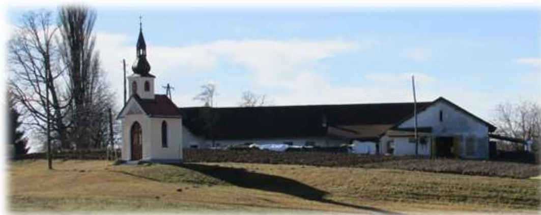
Slika 66: Kmetija pri Gečevih