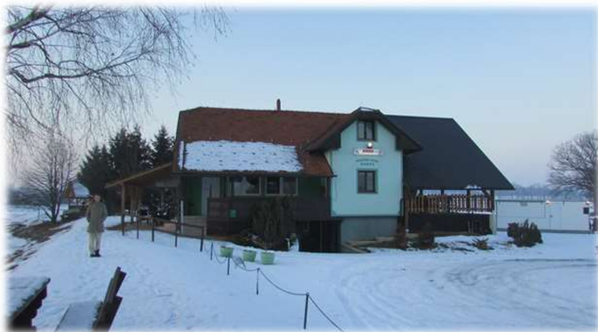
Slika 52: Ribiški dom, Savci