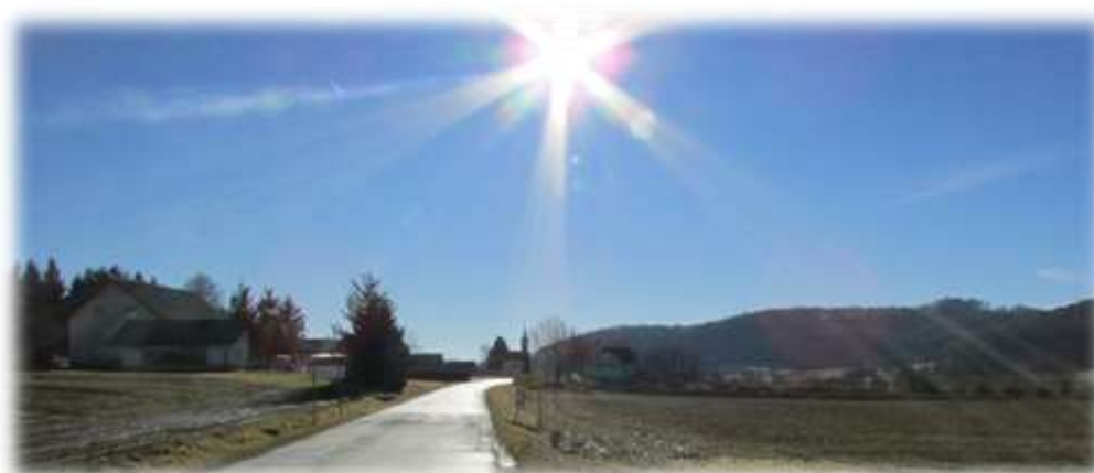
Slika 59: Sejanca pod opoldanskim soncem