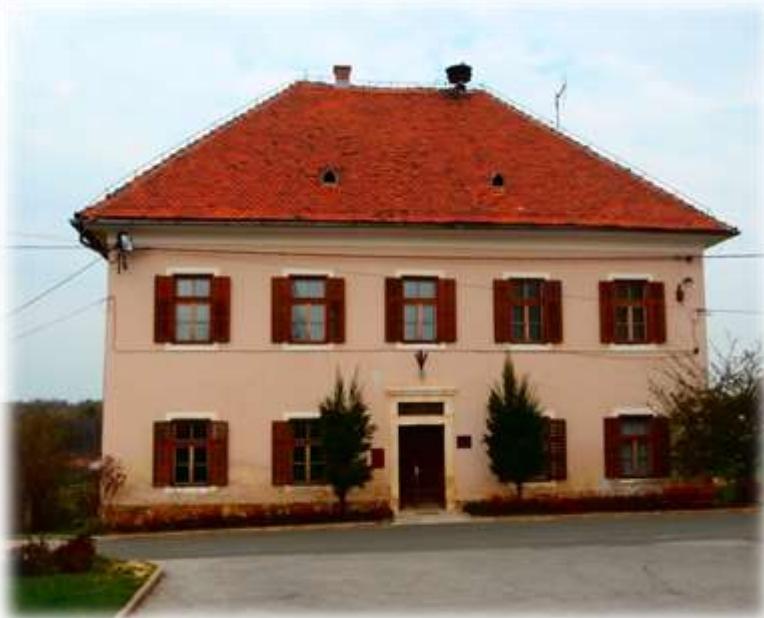
Slika 73: Stara šola

Učenci naše šole so pred leta 2006 pomagali pri zbiranju starega orodja, različnih pripomočkov, slik in drugih predmetov na področju naše občine. Pripeljali so tudi ohranjeno pohištvo iz Meškove rojstne hiše, preden so jo podrli, in sicer: posteljo, omaro, mizo, knjige. Ker muzeja v občini nimamo, so predmete shranili v nekdanji stari šoli. Učenci naše šole in naši krajanji so si predmete že večkrat ogledali.