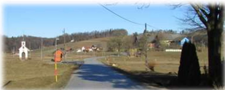
Slika 44: Po cesti skozi Rucmance