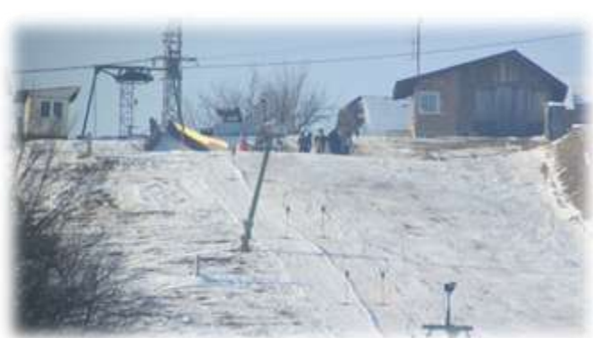
Slika 21: Vrh Globokega klanca