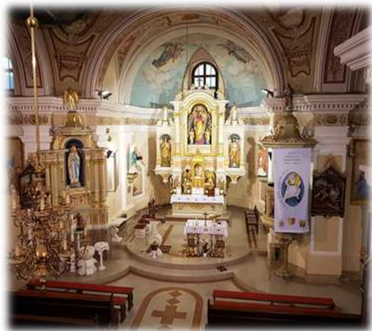
Slika 70: Cerkev Svetega Tomaža – notranost