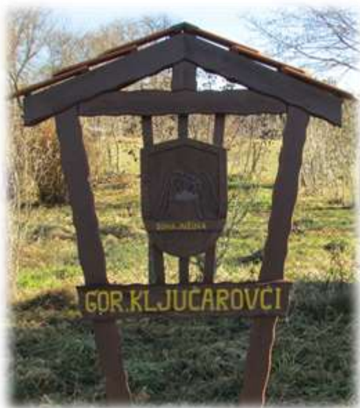
Slika 9: Grb vasi Gornji Ključarovci

Vaški grb je suha južina, ki jo ponekod imenujejo tudi Matija. Spada v red pajkovcev, ki pa ne plete mreže. Ima majhen trup, z štirimi pari zelo dolgih nog, ki rade odpadejo. Tu na grbu bodo noge ostale. 8