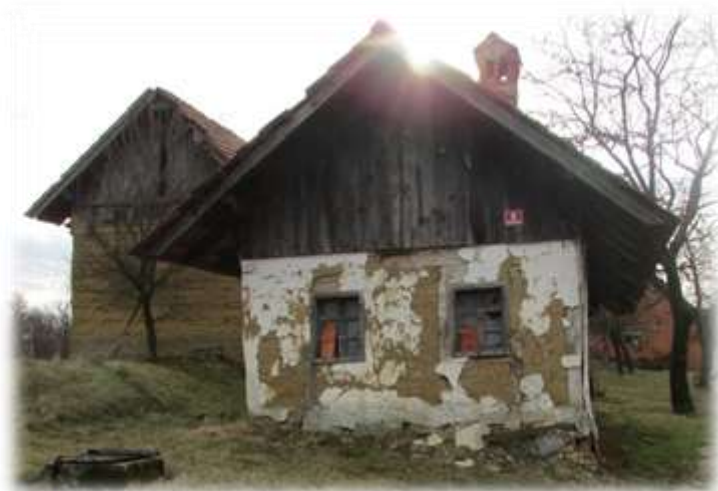
Slika 16: Cimprana hiša, v ozadju butana hiša