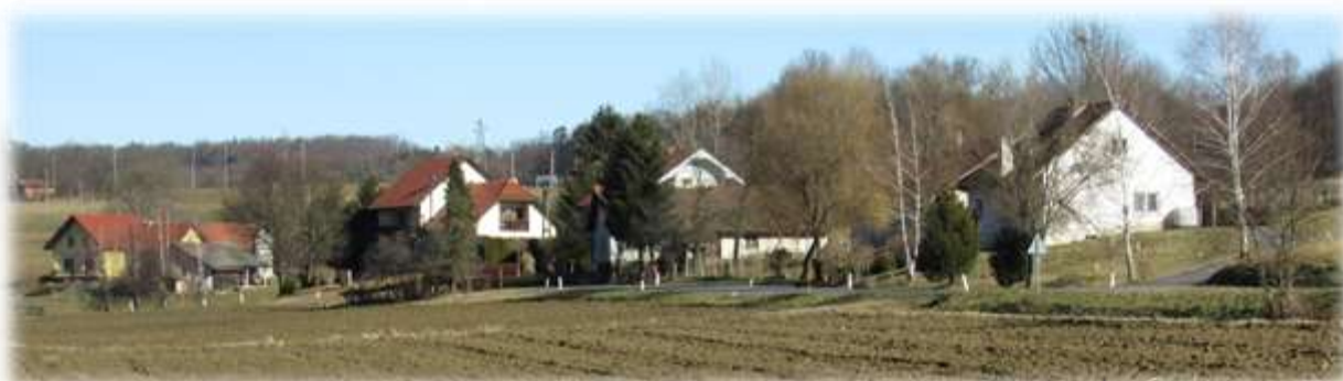
Slika 11: Pogled na del vasi Gornji Ključarovci