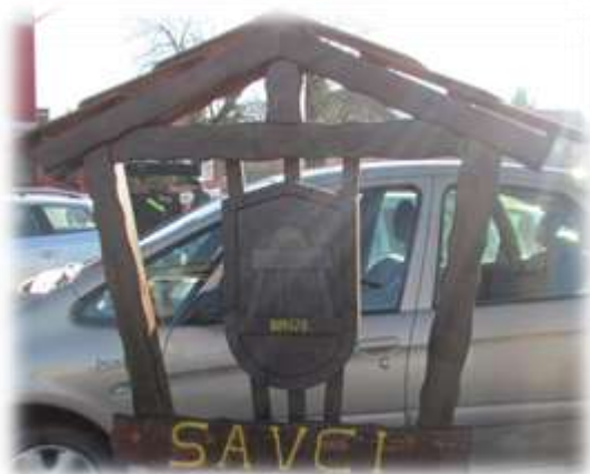
Slika 45: Grb vasi Savci

V grbu imajo Savčari brus, ki se uporablja za brušenje kovinskega premičnega orodja. Za Savčane pa pravijo, da so si z brusom gladili človeško jezo. Od tod tudi brus v vaškem grbu. 30