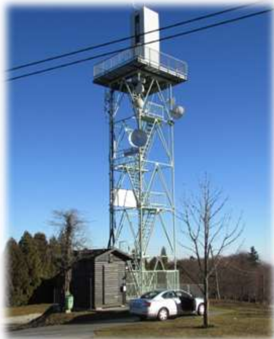
Slika 63: Razgledni stolp na Gomili