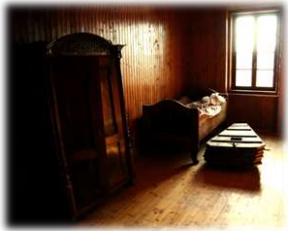
Slika 13: Pohištvo iz Meškove rojstne hiše

Meško velja za širokosrčnega človeka in prepričljivega pisatelja. Kako pomemben je, priča tudi to, da je dobil mesto v občinskem grbu.