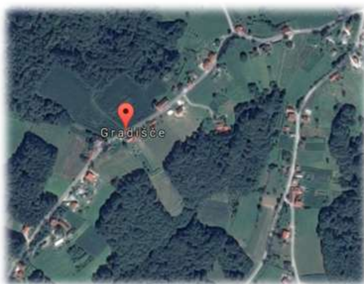
Slika 15: Gradišče iz zraka