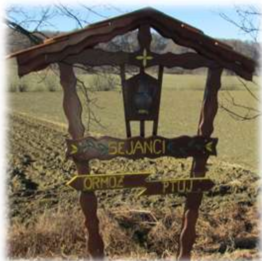
Slika 57: Grb vasi Sejanca

Simbol vasi je dükel kiseline, ki je tudi na vaškem grbu. To je lončena posoda s sirotko. Ki jo imenujemo kisilina. Pred tem so imeli Sejančani v vaškem grbu poln lojtrski voz naložen s sirotko. 35