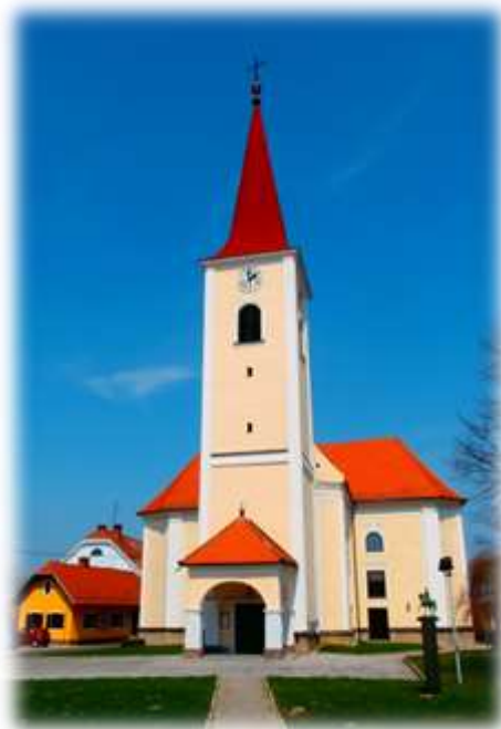
Slika 69: Župnijska cerkev Svetega Tomaža – zunanost

Župnišče je v zasnovi iz let 1840 in 1885. 44