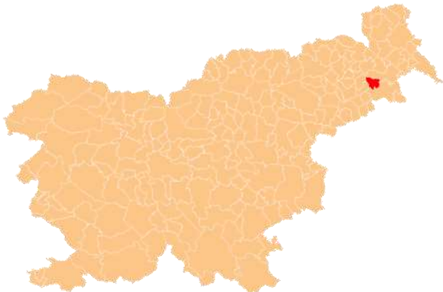
Slika 2: Lega občine Sveti Tomaž v Sloveniji