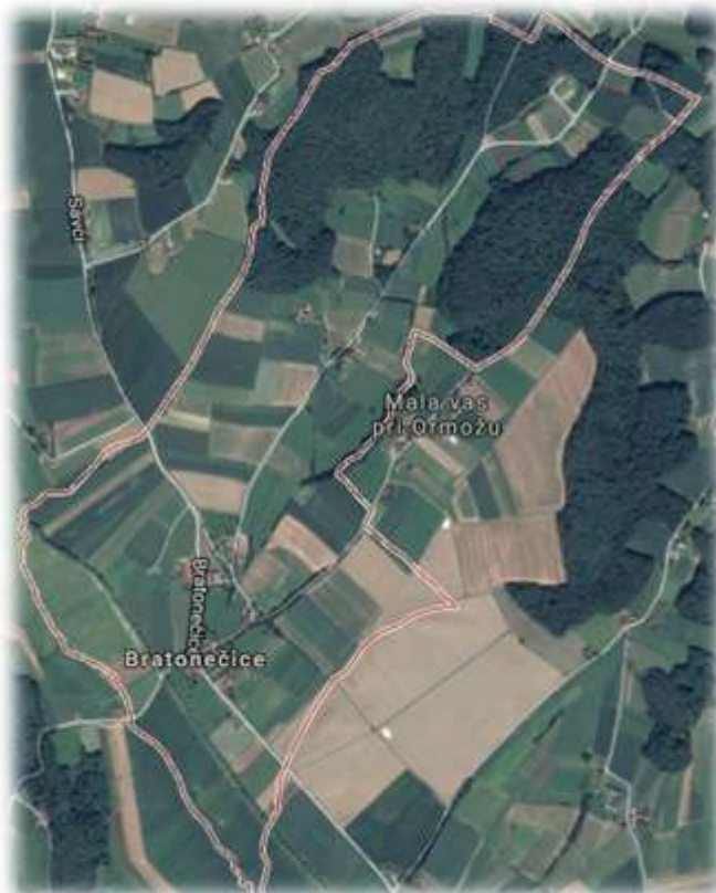
Slika 7: Bratonečice iz zraka