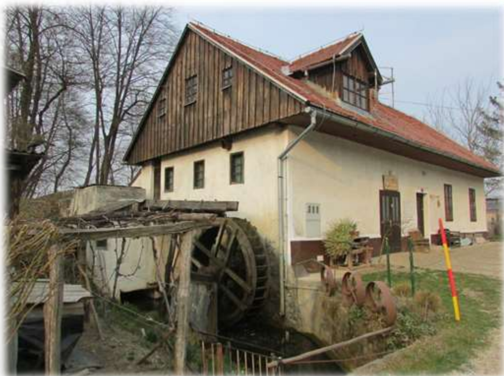
Slika 56: Kolo Stajnkovega mlina se ne vrti več...