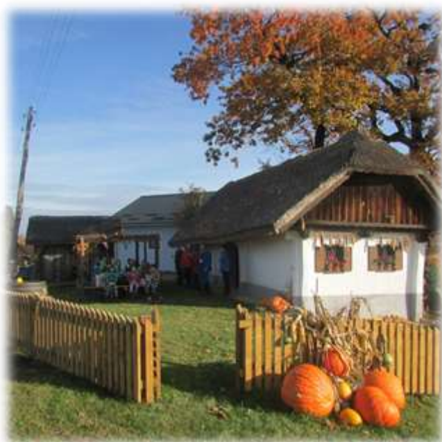
Slika 27: Obnovljena zunanost Brumnove hiše

Brumnovi dobro skrbijo za hišo, zato se je hiša v nespremenjenem stanju tudi ohranila. Pri Brumnovih so se že izmenjale 3 generacije. Vse so zgledno skrbele znajo. Pod okriljem Zavoda za varstvo kulturne in naravne dediščine je bila hiša 2011 temeljito obnovljena in na novo prekrita. V hiši lahko vidite predmete, ki so se ohranili na njihovi kmetiji. Tako nam bodo predstavili življenje nekoč.