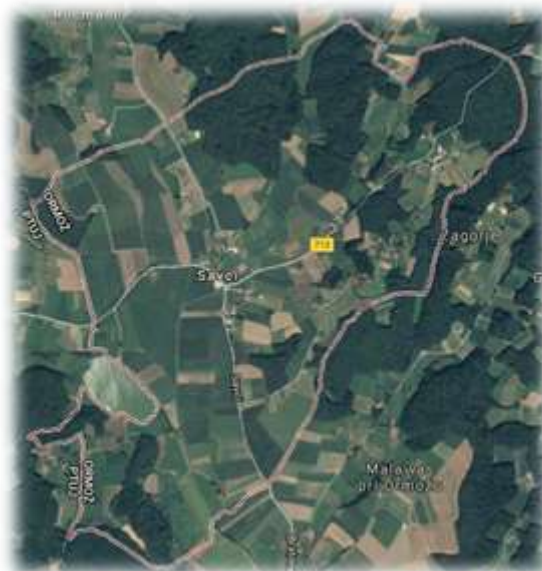
Slika 46: Savci iz zraka