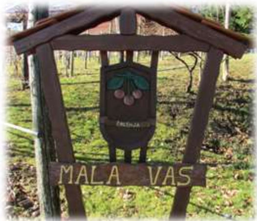
Slika 29: Grb vasi Mala vas

Simbol v grbu Male vasi so češnje, ki obilno rodijo. Te ponazarjajo obilnost tega sadja, ki jim je ob dobri letini s prodajo v mestih in tistih vaseh, kjer ta sadež ni tako dobro uspeval, prinašal dohodek za preživetje. Kuhali so tudi češnjevo žganje, ki je bilo nekaj posebnega. 20 V vasi je ohranjena najstarejša klečaja.