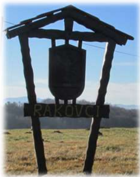
Slika 38: Grb vasi Rakovci

Ob domačiji Voršič, ki stoji na Rakovskem vrhu, se obiskovalcem ponudi čudovit razgled na jugovzhod.