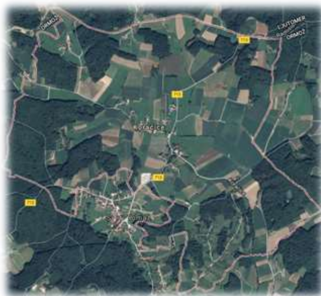
Slika 25: Koračice iz zraka