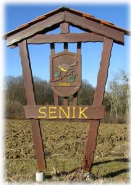
Slika 64: Grb vasi Senik

V vaškem grbu je sinica, ki je tukaj imela veliko možnosti za preživetje. 40