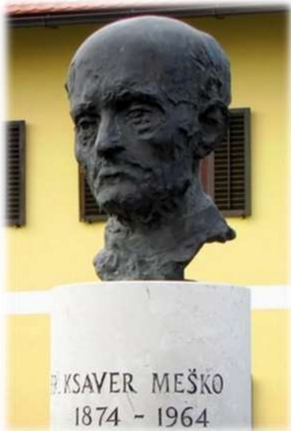
Slika 72: Spomenik Franu Ksavru Mešku

VIR: https://www.prlekija-on.net/lokalno/8454/sveti-tomaz-vrata-prlekije.html