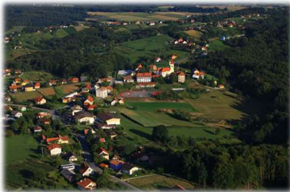
Slika 1: Panorama Svetega Tomaža

Potrudili smo se za ličen in praktičen pregled našega kraja , ki bo popotnika očaral, da se bo rad vračal med Tomaževčane. Pri tem nam bo pomagal naš nagajivi Lučkar , ki je tokrat dobil novo nalogo – ne nagajati, temveč biti prijeten sopotnik po Svetem Tomažu in okoliških vaseh.