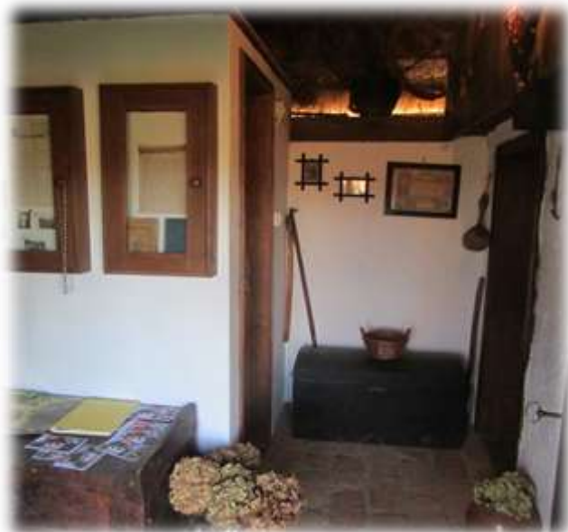
Slika 28: Zbirka starih predmetov v notranjosti Brumnove hiše