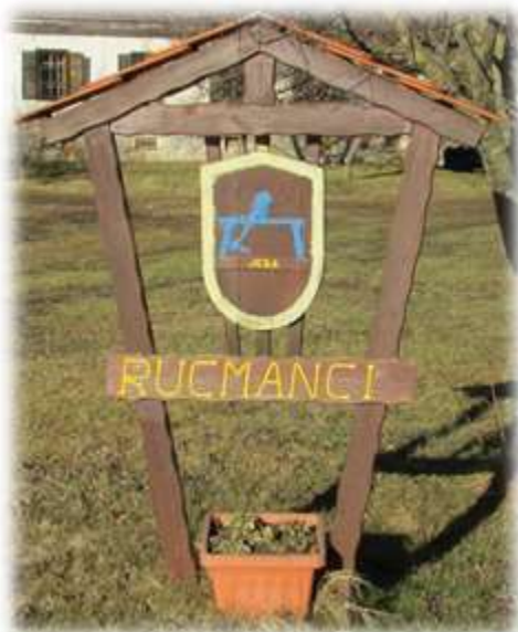
Slika 41: Grb vasi Rucmanci

V vaškem grbu je jeza, imenovana tudi obročnjaki ali hanzek. To je enostaven, toda priročni pripomoček za izdelavo kmetijskega orodja iz lesa. V starejših zapisih pa imajo Rucmanci v grbu ježa ali metulja. Je tudi ena izmed redkih vasi v Sloveniji, kjer je moč najti ogroženo vrsto ptice zlatovranke. 28