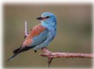
Slika 43: Zlatovranka