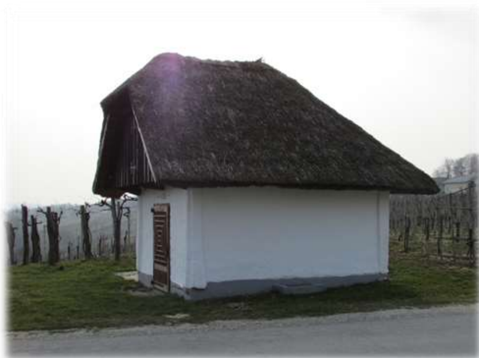
Slika 20: Obnovljena ključaja (Mala vas)

Po eni izmed razlag bi naj dobila ime po velikem in močnem ključu, ki je varoval kmetov pridelek. V pogovorni obliki se je e spremenil v ozki i, kar se na območju severozahodno od Ormoža pogosto zgodi. Tako dobimo pogovorno ime vasi Kličarovci. Če pobrskamo, ugotovimo, da je Meškova rojstna vas dobila ime po gradnji hiš »v ključ«. Prav tako pri klečaji nadomesti e ali u (klučaja) v ozki i in tako lahko sklepamo, da je ta zanimiva stavba dobila ime po močnem in velikem ključu. 14