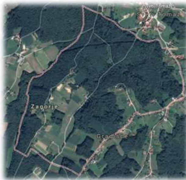
Slika 79: Zagorje iz zraka