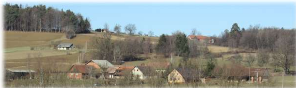
Slika 26: Pogled na del vasi Koračice