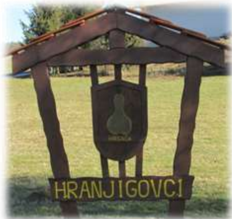
Slika 17: Grb vasi Hranjigovci

V vaški grb so vaščani dali hrgačo, to je podolgovata buča – tikev. Pri nas tej buči pravimo šef. Lepo posušene in očiščene buče so uporabljali za jemanje pijače iz soda. Danes služijo kot dekoracija. V vasi je ohranjenih več starih lesenih vinskih kleti. 13