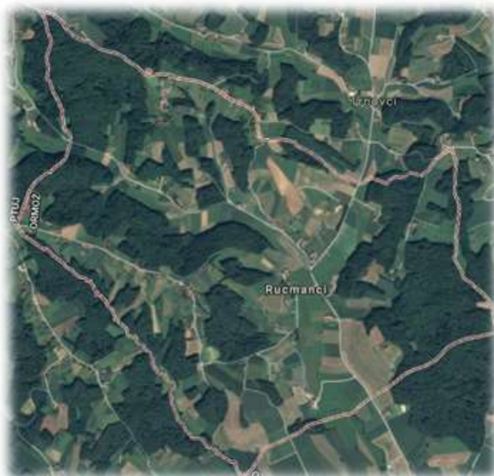
Slika 42: Rucmanci iz zraka