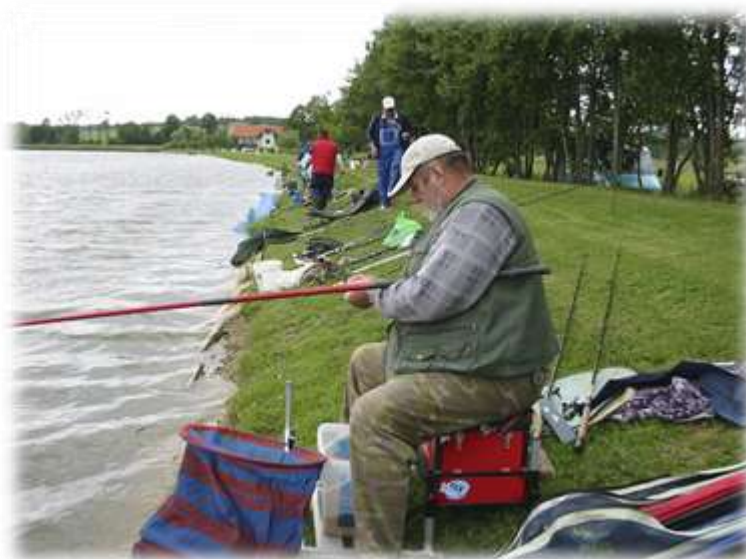
Slika 51: Druženje ribičev ob Savskem ribniku