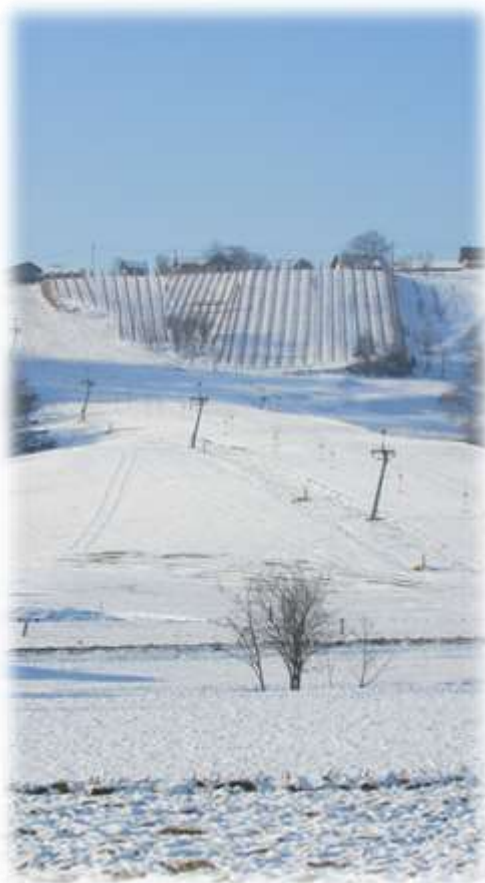
Slika 23: Vlečnica in vodni top

Njihova Facebook stran: https://www.facebook.com/Smu%C4%8Di%C5%A1%C4%8De-Globoki-klanec-167463473447183